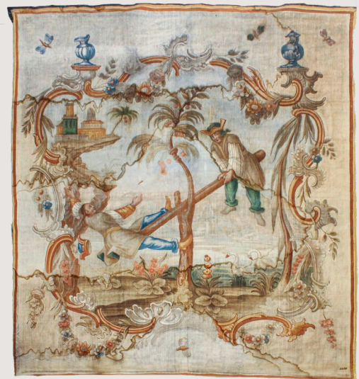
Slikana tapeta iz Kitajske sobe dvorca Novo Celje (Narodni muzej Slovenije)

Nemška nacionalsocialistična oblast je po zasedbi slovenskega ozemlja leta 1941 začela izvajati nasilno germanizacijo, pri čemer je imela pomembno vlogo tudi kulturna politika. V predavanju bodo predstavljena nemška prizadevanja za pridobitev izbranih kulturnozgodovinskih predmetov iz ljubljanskih muzejskih zbirk, ki so se tedaj nahajale pod italijansko okupacijsko upravo v Ljubljanski pokrajini. Med temi muzealijami so bile arheološke najdbe, srednjeveške in baročne slike ter kipi, pa tudi posamezni predmeti nekdanjih nemških društev. Vsem predmetom je bilo skupno, da jih je nacistična oblast razumela kot nemški kulturni patrimonij in jih kot takšne želela vrniti v nemški rajh. Skozi obravnavani primer bodo prikazane glavne značilnosti in posebnosti nemške kulturne politike ter odnos nacistične oblasti do kulturne dediščine na Slovenskem. Obenem bo problematika obravnavana v kontekstu etnocidne politike, ki jo je nemška oblast izvajala na zasedenem ozemlju, in v okviru nemških političnih prizadevanj po čimprejšnji priključitvi zasedenega ozemlja k tretjemu rajhu.