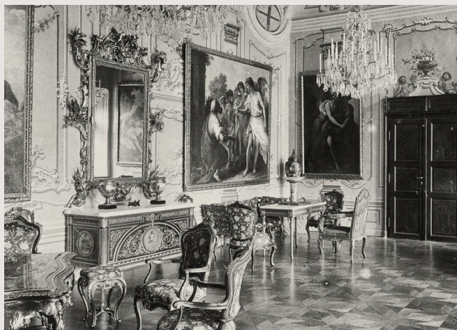
Veliki salon v murskosoboškem gradu na fotografiji iz let 1895–1899