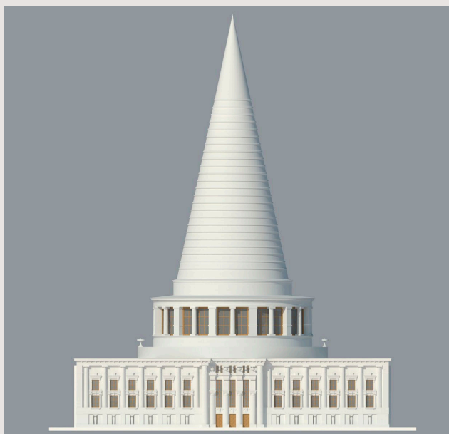
Frontalni pogled na Katedralo svobode. 3D vizualizacija

O projektih arhitekta Jožeta Plečnika za Ljubljano je bilo napisanega že veliko. Manj pa je znanega o njegovih številnih načrtih, ki realizacije iz takšnega ali drugačnega razloga niso dočakali. Nekateri od teh projektov so še danes videti drzne ali celo predrzne vizije. Svoje vizije z rojstnega mesta je začel uresničevati po letu 1921, ko se je za stalno naselil v Ljubljani. Svoje projekte je v urbanistično mrežo vnašal premišljeno in med seboj povezovalno. Z občutkom je prepletal preteklost in svoja vizionarska razmišljanja. Velikopotezni neuresničeni projekti, ki bodo predstavljeni, bi močno spremenili podobo današnje prestolnice. Na Vodnikovem trgu bi Plečnikove tržnice dopolnjeval Novi magistrat s pokritimi tržnicami, Petkovškovo nabrežje pa bi povezoval pokriti Mesarski most. Grajski grič bi bil z mestnim trgom povezan z monumentalnim stopniščem ob Magistratu. V mestnem parku Tivoli bi se s svojim mogočnim stožcem postavljeno na kvader dvigala ikonična Katedrala svobode. Izbrani neuresničeni projekti so bili poustvarjeni s 3D modeliranjem, vizualizacijami, video animacijami in 3D tiskom.