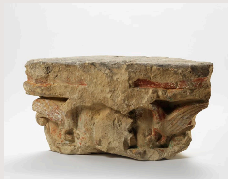
Eden od redkih stavbnih členov, ohranjenih iz srednjeveške križevniške cerkve v Ljubljani. Gre za kapitel, na katerem sta še vidna dva zmaja, obrnjena eden proti drugemu.

V predavanju bodo analizirani pisni in vizualni viri, ki so v pomoč pri rekonstrukciji srednjeveške cerkve nemškega viteškega reda v Ljubljani, na mestu katere danes stoji monumentalna baročna centralna arhitektura. Predstavljena bo hipoteza o prvotnem tlorisu in izgledu križevniške cerkve in njenih srednjeveških stavbnih fazah. V nadaljevanju bomo odgovorili na vprašanje, kakšna arhitektura je bila v srednjem veku značilna za cerkve nemškega viteškega reda in kakšno mesto v tej skupini pripada ljubljanski cerkvi. V zadnjem delu predavanja se bomo osredotočili na evropske zglede, ki bi bili lahko odločilni za zasnovo srednjeveške križevniške cerkve. Posebna pozornost bo pri tem posvečena vprašanju, kakšno vlogo so pri stavbni zasnovi imele dinastične in politične povezave koroškega vojvode Ulrika III. Spanheimskega, graditelja ljubljanske cerkve. Predstavljena bo tudi njena funkcija pri širjenju češčenja izjemno vplivne evropske svetnice sv. Elizabete Ogrske/Turingijske.